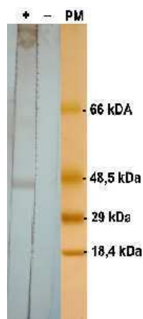
Figura 3 – Resultados da sorologia por Western blot realizada para confirmação do caso: Linha (+): soro do paciente revelando a presença de anticorpos produzidos contra o componente de 43kDa; Linha (-): soro controle negativo; Linha (PM): padrão de pesos moleculares.